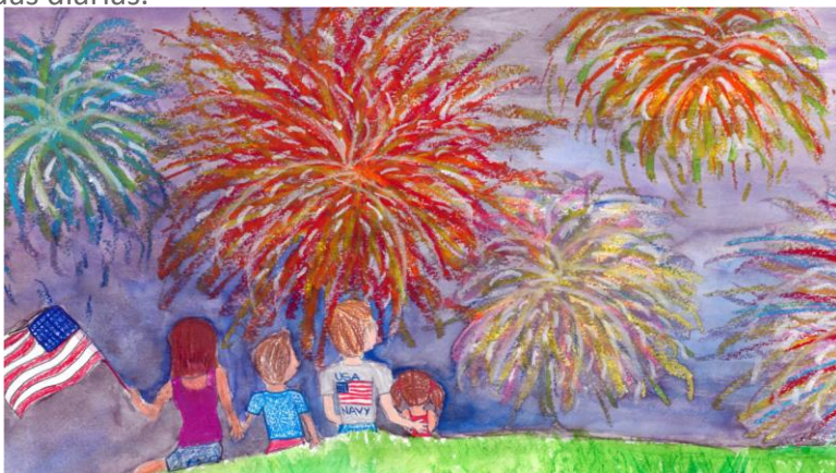
“Juegos Pirotécnicos”, por Isabelle de Estados Unidos